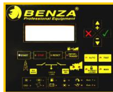
Fig.2 Controlerul digital al panoului de transfer sarcina