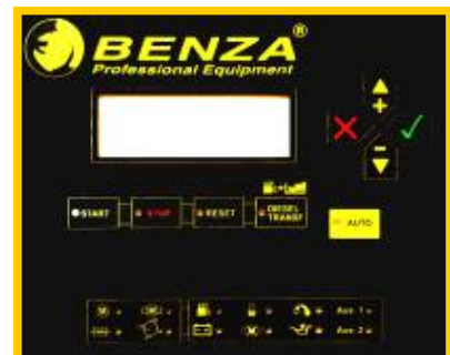
Fig.1 Controlerul digital al generatorului de curent